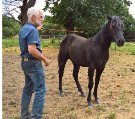
Desensibilisierung mit Stick