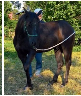
schon sehr elegant