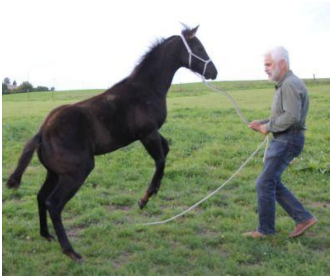
Hier beim ersten Mal