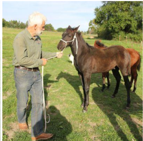
Dann nach einiger Zeit