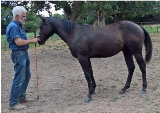
Rückwärts mit Gefühl