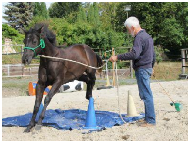
noch etwas flott über die Plane