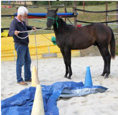
Am Anfang aufgereg