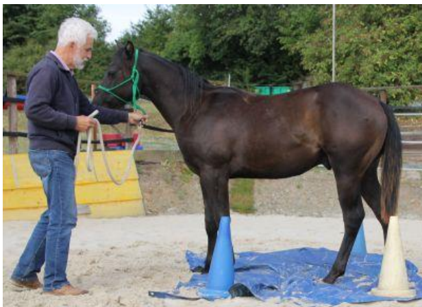
Jetzt schon entspannt