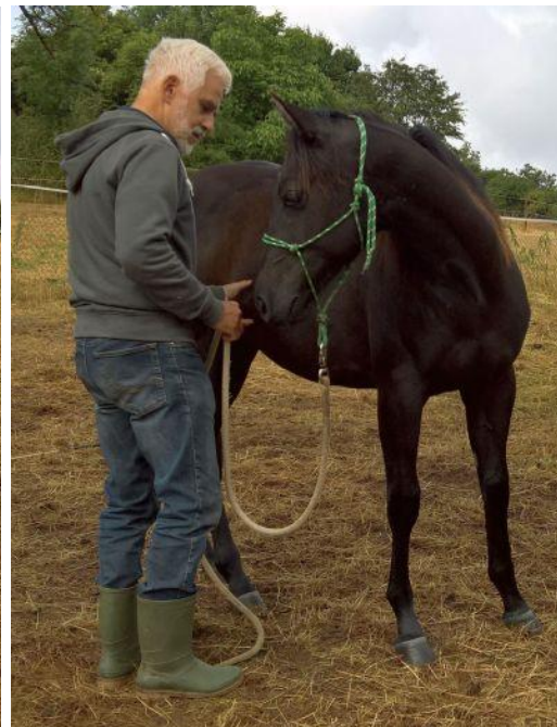
Biegung und HH