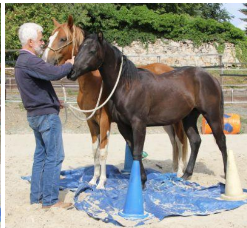
schließlich ohne Halfter