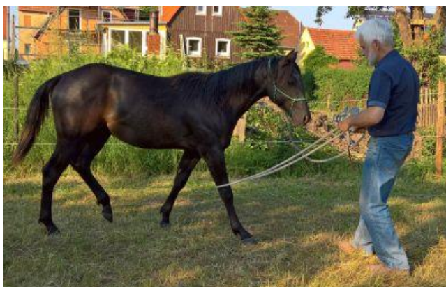
Folge einem Gefühl am Bein